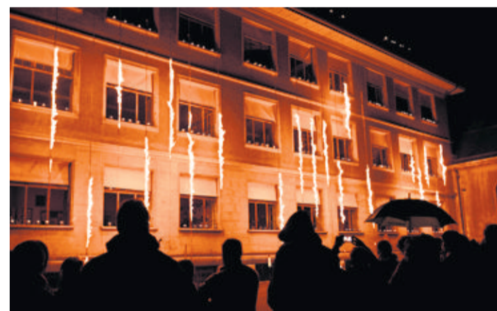
L'illumination de 19 mèches suspendues aux fenêtres du collège était l'un des clous de la soirée d'anniversaire. PATRICK MARTIN

La célébration du centenaire n'est pas encore totalement terminée: un bal public sera organisé le 27 juin. G.S.